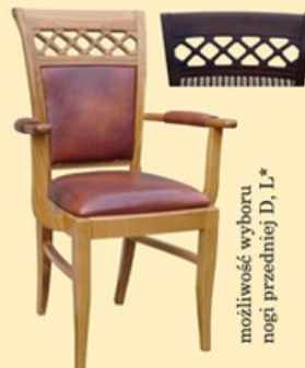
Krzesło G25K z podłokietnikiem