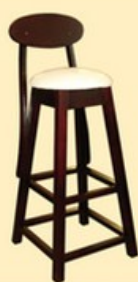
Hoker z oparciem