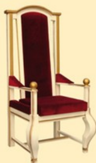
Tron Biskupi niższy