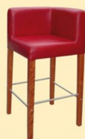
Hoker kwadrat narożny