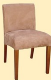
Krzesło S1 niższe