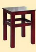
Taboret siedzisko twarde