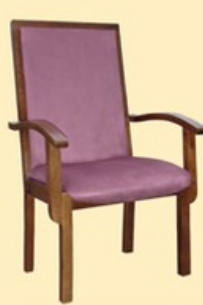
Sędziowskie 2 niższe