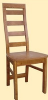
Krzesło G26b siedzisko twarde