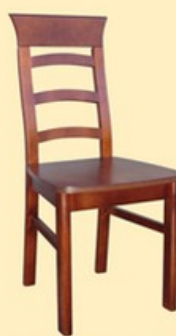
Krzesło G23B siedzisko twarde