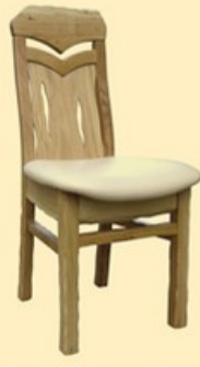
Krzesło G24 góralskie

możliwość wyboru nogi przedniej P, K, L*